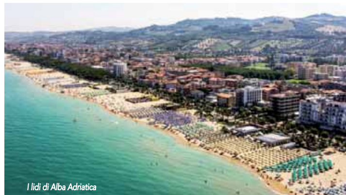
I lidi di Alba Adriatica

Torrione costiero del XVI secolo ed un numero imprecisato di ville gentilizie settecentesche. Particolarmente sviluppata l'industria legata alla produzione di scarpe e borse in pelle, di abbigliamento. Ricca la presenza di attività di ristorazione e bar di tutto rispetto. Più delle altre sorelle, esprime la sua qualità di cittadina ridente, con l'arrivo della stagione estiva per la particolarità degli stabilimenti e di un lungomare comodamente passeggiabile. Di particolare importanza il Carnevale estivo che si svolge ormai da venticinque anni nel mese di agosto e che, stante la popolarità acquisita, in qualche caso si è trasferito per un bis in altre località costiere. Insorge qualche tentativo di imitazione, ma senza ragguardevole successo. Molto bello il tratto urbano della Ciclovia adriatica , di cui parliamo in altra parte di questa guida, che in questo tratto diventa affascinante per la presenza di ponti in legno sui fiumi e torrenti che consentono di