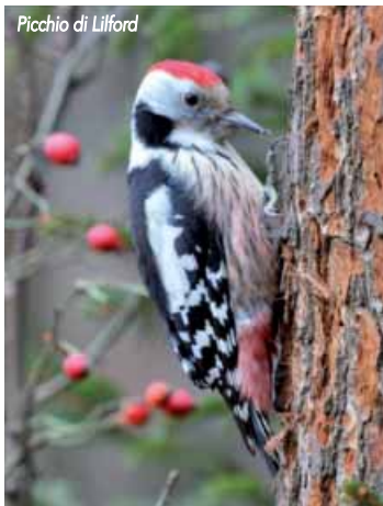
Picchio di Lilford

meritano di essere menzionate. Nel bosco si incontrano di frequente la Ghiandaia, il Picchio verde , facilmente individuabile dal caratteristico "tambureggiare" mentre cerca gli insetti sui tronchi degli alberi e l' Upupa , un uccello che nidifica nei boschi, ma ama cacciare nelle ampie radure.