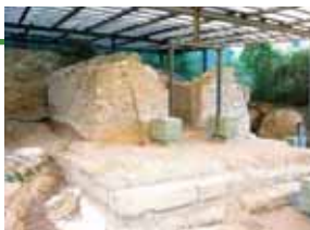
Il Tempio di Ercole

anno ospita la statua della Vergine durante la relativa processione, il Convento della Santissima Concezione dei Frati Zoccolanti , il Monastero dei Cappuccini ed infine la Chiesa di San Lorenzo una piccola chiesa privata situata all'inizio di Montorio. Un settore di primaria importanza per la cittadina è il commercio, mentre la zona artigianale è ricca di insediamenti produttivi. Numerose sono le piccole e medie imprese sul territorio, con una particolare presenza di una multinazionale irlandese la Ardagh Glass che produce bottiglie per famosi marchi nazionali di birra.