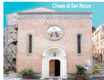
Chiesa di San Rocco

naturali del territorio, in particolare l'abbondante presenza di cave d'argilla, boschi di faggio per la legna e i forni, i corsi d'acqua, giacimenti di silice. La tradizione della ceramica si è sviluppata a Castelli già in epoca etrusca e favorita sicuramente dalla presenza dei monaci benedettini. È dalla seconda metà del 1500 che questa arte vive il suo