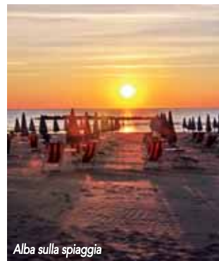
Alba sulla spiaggia

Una passeggiata al borgo di Tortoreto Alto. Una giornata all' Acquapark Onda Blu dove ci si abbronzia in un solo pomeriggio tra scivoli e giochi per grandi e piccini. Una visita ai numerosi spacci aziendali per l'acquisto di borse ed articoli in pelle.