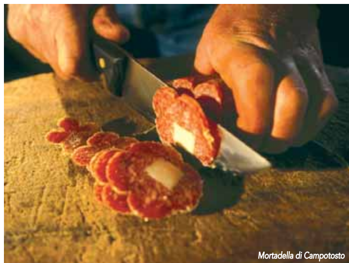
Mortadella di Campotosto

d'identificazione più rilevanti sono rappresentati dagli ingredienti che intervengono nelle lavorazioni e che sono tutti tratti dalle radici della gastronomia popolare. Così si spiega la frequente presenza del peperoncino, protagonista del sapore non soltanto nella salsiccia di fegato, ma anche nella concia del prosciutto crudo. Si dice che nell'Abruzzo meridionale, al momento dell'uccisione del maiale bisogna avere a disposizione una sedia robusta e un bicchierone di vino. Infatti il capofamiglia a cui sovente tocca l'incombenza, dopo aver assestato la coltellata mortale al suino ha quasi un mancamento. Si accascia sulla sedia e traccana una bella dose di