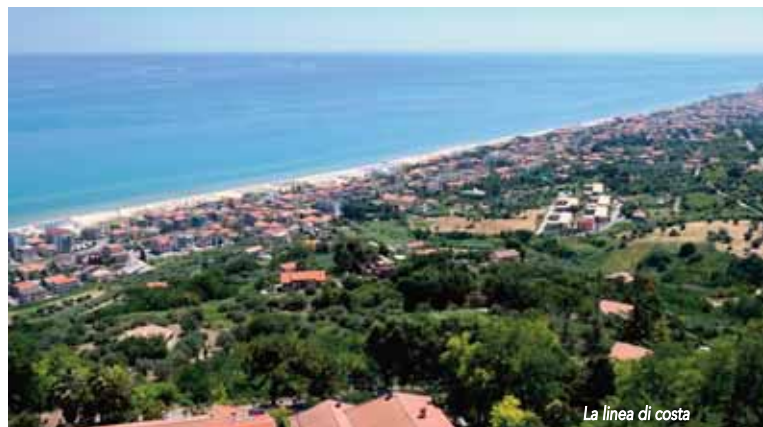
La linea di costa

Colazione ricca al Bar Atene e al Charlie Brown , entrambi sulla centralissima via. A pranzo e cena consigliamo l' Isola felice e La Lanterna (anche asporto), e per un menu più ricco di pesce Alusea .