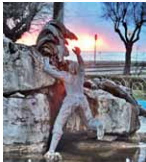
Il Monumento ai caduti

La storia ci propone la chiesa di Santa Maria Assunta con pitture di Celommi ed il borgo di Montepagano con vicoli e scorci, oltre ad un invidiabile panorama sul mare. Qui, anche la chiesa dell'Annunziata del XVI secolo ed il suo meraviglioso campanile. Il tessuto economico si arricchisce di molte realtà industriali nel campo farmaceutico ed alimentare. Rilevante la presenza di attività commerciali, da renderla appetibile