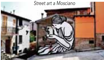
Street art a Mosciano

arte espressiva. Passeggiare per il paese è suggestivo ed interessante. Infatti è particolarmente emozionante vedere come diverse pareti siano diventate le tele di questi straordinari artisti che hanno donato a Mosciano un carattere unico nel suo genere.