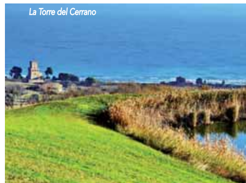
La Torre del Cerrano

mollusco che ha avuto il maggior successo evolutivo, soprattutto grazie ad adattamenti anatomici.