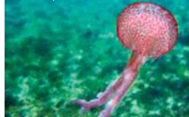
Un raro esemplare di medusa

qualche problema al momento dell'incontro. Stiamo parlando dello squalo, della razza e delle meduse.