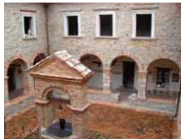
Chiostro del Convento dei Frati Zoccolanti

anno ospita la statua della Vergine durante la relativa processione, il Convento della Santissima Concezione dei Frati Zoccolanti , il Monastero dei Cappuccini ed infine la Chiesa di San Lorenzo una piccola chiesa privata situata all'inizio di Montorio. Un settore di primaria importanza per la cittadina è il commercio, mentre la zona artigianale è ricca di insediamenti produttivi. Numerose sono le piccole e medie imprese sul territorio, con una particolare presenza di una multinazionale irlandese la Ardagh Glass che produce bottiglie per famosi marchi nazionali di birra.