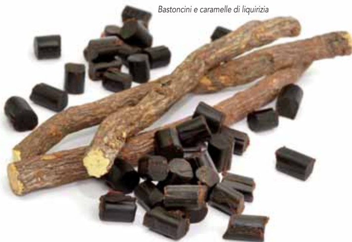
Bastoncini e caramelle di liquirizia