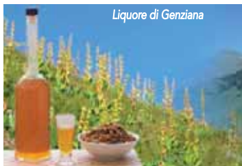
Liquore di Genziana

La genziana è una pianta erbacea perenne originaria dell'Europa centro-meridionale il cui fusto può raggiungere il metro di altezza e la fioritura avviene prevalentemente in estate. Il termine genziana ha origini antichissime e testimonia il suo utilizzo già in epoca classica. Esso, infatti, deriva dal nome del re dell'Iliria, Gentius, che secondo la tradizione fu il primo a scoprirne le virtù nel corso del 2° secolo a.C. Un'altra leggenda narra di cavalieri vittime di incantesimi d'amore provocati dalla bellezza dei fiori e dal fascino mistico della pianta. La genziana viene utilizzata in caso di cattiva digestione dovuta a pasti abbondanti o ricchi di grassi, perché stimola la produzione dei succhi gastrici e come amaro tonico. Viene utilizzata in molti liquori amari assunti in genere come digestivi a fine pasto e in numerosi preparati farmaceutici per