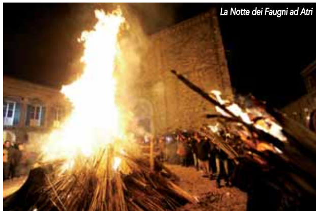
La Notte dei Faugni ad Atri

Teramo • Festa della Pace (ultima domenica di aprile) • Ballo dell'Insegna a Forcella (23-24 settembre) • Trionfi della Pace (26 luglio), festa rinascimentale • Processione della Desolata (Venerdì Santo).