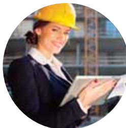
VIABILITÀ E OPERE FLUVIALI