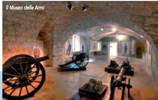
Il Museo delle Armi

armi degli eserciti borbonico e Sabauda. La terza sala accoglie il cippo confinario che segnava la linea di confine tra lo Stato Pontificio e il Regno delle due Sicilie. Nella Sala Rinascimentale vi sono custodite le armi più antiche dell'esposizione.