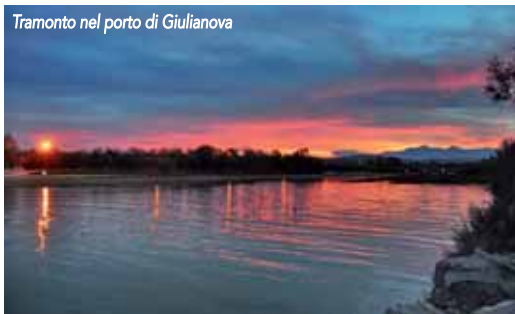
Tramonto nel porto di Giulianova

In vacanza o tutto l'anno segnaliamo l' Hotel Don Juan , un prestigioso quattro stelle, e per chi vuole regalarsi atmosfere collinari