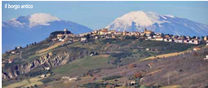
Il borgo antico

presta a salutari passeggiate con vista mare.