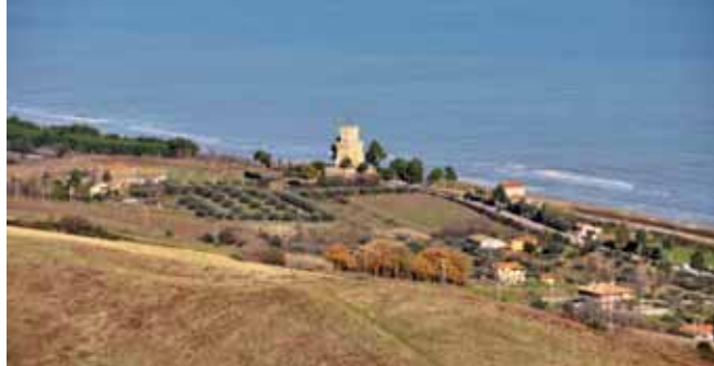
La Torre tra Pineto e Silvi

per il commercio marittimo dell'Abruzzo che fu distrutto dalla repubblica di Venezia insieme a quasi tutti i porti adriatici. Una rinascita della zona la dobbiamo a Carlo V, che decise di costruire un efficiente sistema di protezione dalle invasioni saracene sulle coste del regno, costituito da torri di avvistamento visibili l'una dall'altra, in modo da poter comunicare velocemente. L'area dell'antico porto venne scelta come luogo dove edificare una delle torri di avvistamento: la Torre del Cerrano . Questa Torre è da oltre 500 anni il simbolo di Silvi e Pineto e