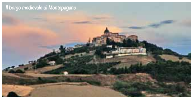
Il borgo medievale di Montepagano