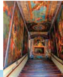
La Scala Santa

antiche tracce risalgono al Medioevo e precisamente all'894. Diversi sono i monumenti che ne testimoniano lo splendore fra questi la Scala Santa , eretta nel 1776 una rarità mondiale, rappresentata da 28 gradini in legno d'ulivo, annessa alla chiesa di San Paolo . La chiesa di Santa Maria in Platea di origine trecentesca a pianta basilicale con un pregevole campanile in stile romanico. La chiesa di San Francesco d'Assisi costruita nel XIV secolo. Il Convento di San Pietro e la Necropoli Italica . Fra i tanti infine il Palazzo Farnese , eretto intorno alla metà del secolo XIV, rappresenta uno dei rari esempi di architettura civile tardo medioevale in Abruzzo.