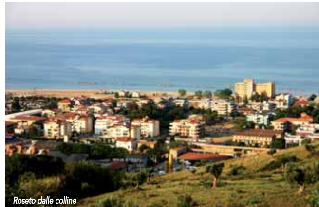
Roseto dalle colline