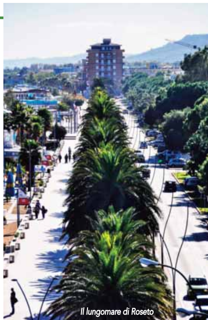
Il lungomare di Roseto

anche per una passeggiata all'insegna dello shopping. Il cartellone delle manifestazioni è particolarmente ricco d'estate con il lungomare che si presta a sfilate di auto d'epoca e cortei folkloristici.