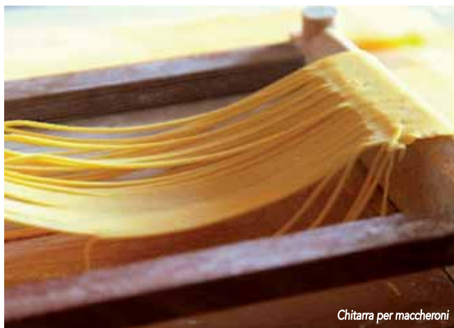
Chitarra per maccheroni

ceppo” e quelli detti “strangolapreti” , che si preparano con una tecnica precisa, molto difficile, facendo un buco in una pagnottella di pasta e ricavandone, con una serie di gesti rapidi e decisi, un unico lunghissimo filo di circa cinquanta metri. Lo si avvolge a matassa e durante la bollitura rimane incredibilmente sodo e sottile, senza rompersi né appiccicarsi. La tecnica di confezione della pasta, passata da una fase artigianale a quella industriale, ha fatto sorgere nella regione una serie di stabilimenti modernissimi che fanno concorrenza ai più famosi pastifici di Napoli. Un segreto dei loro ottimi prodotti è la farina di grano duro impiegata e il fatto che si è tenuto conto, nella lavorazione meccanica, della antica preparazione manuale e casalinga. Queste paste sono distribuite in molte parti d'Italia e consentono di riprodurre piatti che si avvicinano molto nel gusto e nel rispetto della tradizione alla ricetta originale.