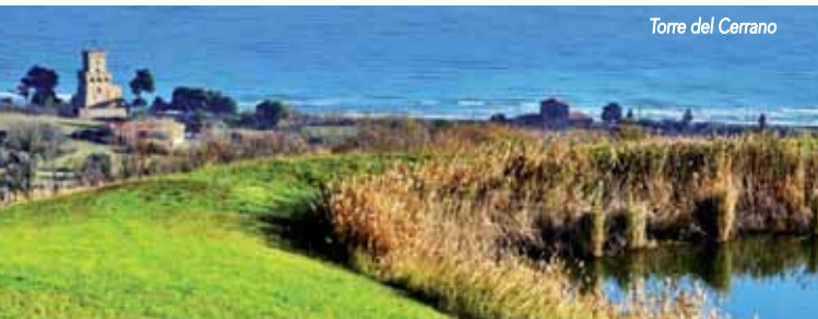
Torre del Cerrano