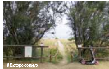
Il Biotopo costiero

Una passeggiata lungo un vasto tratto di spiaggia libera dove si estende l'area del biotopo costiero , uno dei pochi luoghi dove è possibile osservare il naturale evolversi dell'area dunale. Nell'area è possibile trovare una flora di rilevante interesse naturalistico, con oltre 40 specie botaniche autoctone e spontanee salvaguardate dal rischio di estinzione.