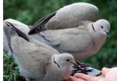
Tortora dal collare

giorni dalla schiusa. Originaria dell'Asia meridionale, si è adattata progressivamente a vivere a fianco dell'uomo nelle nostre città. Pastura al suolo e si abbeverava negli abbeveratoi degli animali da cortile e nelle fontanelle dei giardini. Il suo volo è agile, accompagnato da improvvise scivolate e rapidi battiti d'ala. La Tortora dal collare è un tipico ospite dei centri abitati; l'abbondanza di siti riproduttivi e di alimenti resa disponibile dalle attività umane, consentono a questo uccello di proliferare.