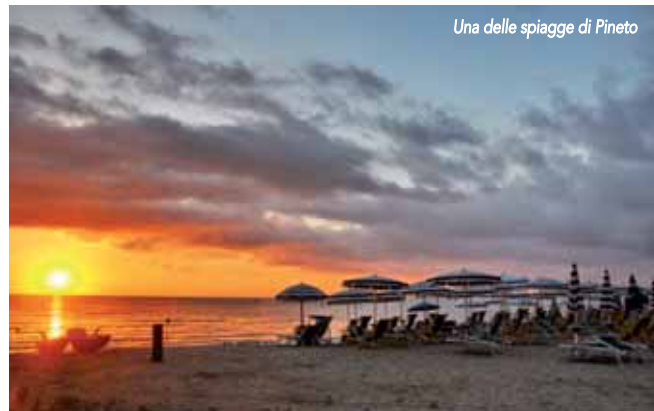
Una delle spiagge di Pineto

Una visita alla vicinissima Atri , città d'arte e storia, ma anche preziosa per i panorami che scopre intorno a se. Panorami da incanto anche nella vicina Silvi alta . Visitate la Torre di Cerrano , la vicina Mutignano , Casoli con i suoi murales.