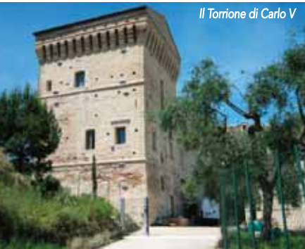
Il Torrione di Carlo V

Per la colazione segnaliamo il bar Ko.Kaos a due passi dal lungomare e il bar Centrale in piazza a Martinsicuro. Per pranzo e cena segnaliamo due ristoranti storici di Martinsicuro quali La Lampara e il Leon D'Oro rigorosamente di pesce.