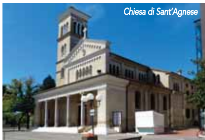
Chiesa di Sant'Agnese

La stessa pista, per il tratto coperto dalla pineta storica si