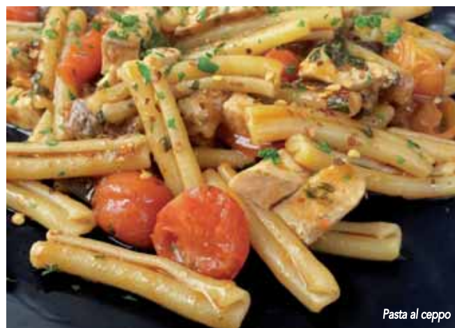
Pasta al ceppo