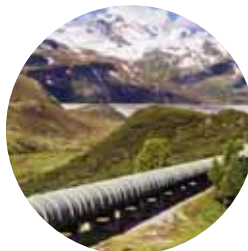
ACQUEDOTTI, GASDOTTI E FOGNATURE