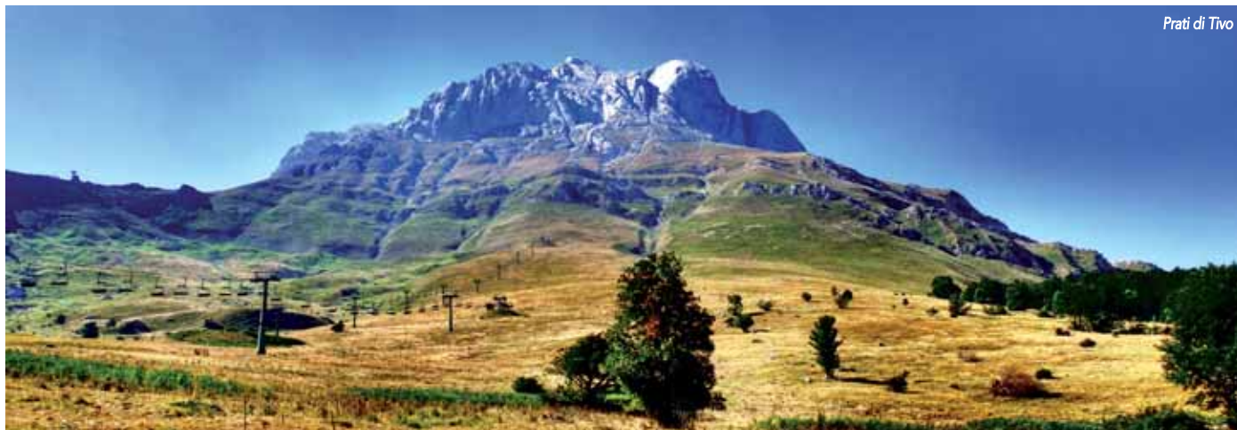
Prati di Tivo

mammiferi sono presenti la volpe , il cinghiale , la martora , il gatto selvatico , il tasso , la faina , la puzzola , l' istrice e diverse altre specie di roditori. Alle quote più elevate, l' arvicola delle nevi , un piccolo roditore, è arrivato con l'ultima glaciazione e qui rimasto come relitto glaciale. Tra gli uccelli troviamo rapaci rari come l' aquila reale , l' astore , il falco pellegrino , il lanario , il gheppio , il lodolaio e il gufo reale . L'avifauna più rappresentativa è quella delle alte quote, con le popolazioni appenniniche più numerose di fringuello alpino , spioncello , pispolo e sordone . Sono stati avvistati dagli abitanti del luogo anche diversi esemplari di airone nei pressi del lago di Campotosto e nel comune di Crognaleto. Natura e storia il binomio del Parco.