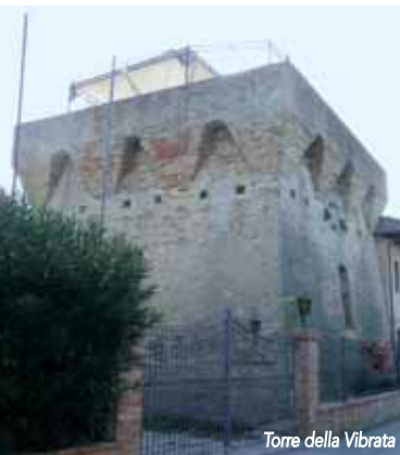
Torre della Vibrata

Si colloca tra Martinsicuro e Tortoreto formando praticamente un unico agglomerato urbano sul litorale adriatico. Per la verità, si