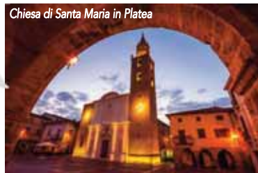
Chiesa di Santa Maria in Platea

antiche tracce risalgono al Medioevo e precisamente all'894. Diversi sono i monumenti che ne testimoniano lo splendore fra questi la Scala Santa , eretta nel 1776 una rarità mondiale, rappresentata da 28 gradini in legno d'ulivo, annessa alla chiesa di San Paolo . La chiesa di Santa Maria in Platea di origine trecentesca a pianta basilicale con un pregevole campanile in stile romanico. La chiesa di San Francesco d'Assisi costruita nel XIV secolo. Il Convento di San Pietro e la Necropoli Italica . Fra i tanti infine il Palazzo Farnese , eretto intorno alla metà del secolo XIV, rappresenta uno dei rari esempi di architettura civile tardo medioevale in Abruzzo.